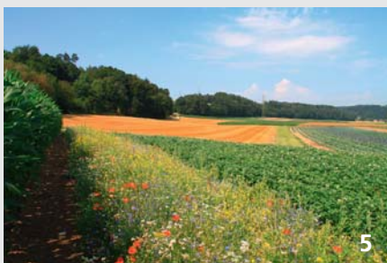
In der Kulturlandschaft können Blühstreifen auch als Verbindungskorridore, z. B. für Laufkäfer, eine wichtige Rolle spielen.