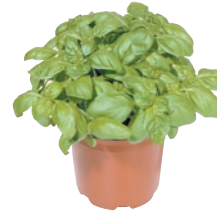
Basilikum im Topf

Bei den abgebildeten Packungen handelt es sich um Produktvorschläge. Sollte ein Produkt davon nicht erhältlich sein, finden Sie in Ihrem Coop eine passende Alternative.