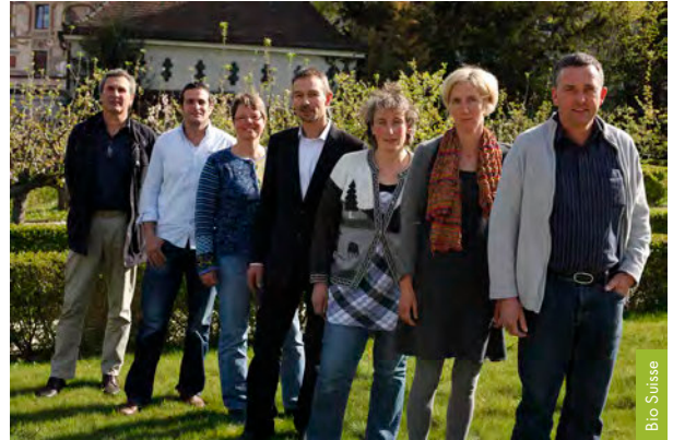
Consiglio direttivo di Bio Suisse